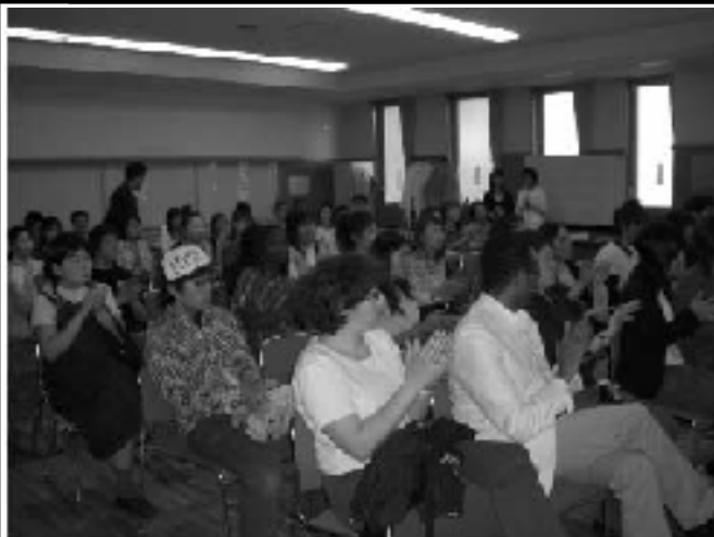
(Gorwe) アフリカへの入り口 (人数 06/05/04 11時)