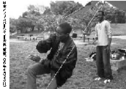
日本アフリカユースネットワーク本部主催、06年11月13日

●ユースのネットワーク ●シヤインの実情 ●アフリカへの入り口 ●アフリカの文化 ●アフリカの経済 ●アフリカの政治 ●アフリカの社会 ●アフリカの教育 ●アフリカの医療 ●アフリカの環境 ●アフリカの文化